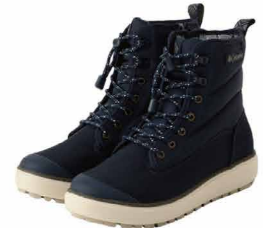
Columbia サップブランド アーク ウォータープルーフ オムニヒート 18700 円 (税込)