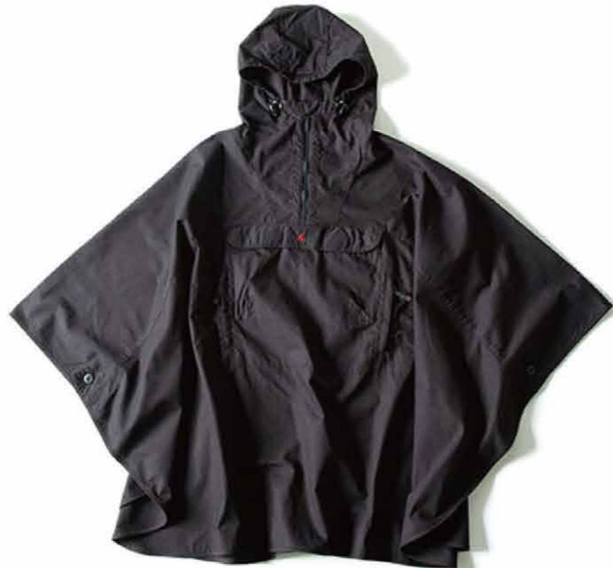
ファイヤーブルーフ ポンチョ 15180 円 (税込)