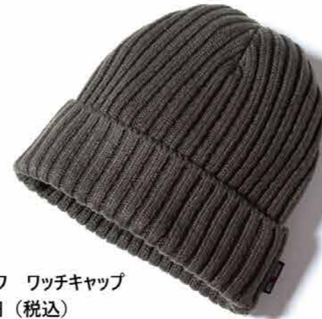
ファイヤーブルーフ ワッチキャップ 3300 円 (税込)