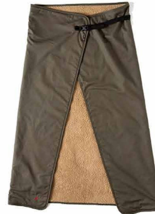
ファイヤーブルーフ ブランケット 6490 円 (税込)