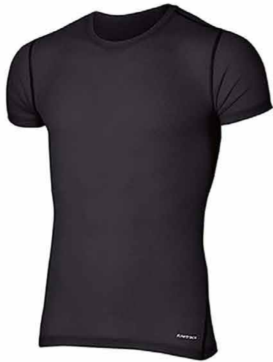
Finetrack DRY LAYER BASIC 4620 円 (税込)