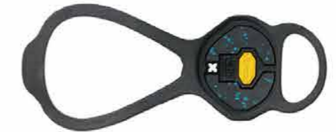
Vibram viblam KANZIKI 3410 円 (税込)