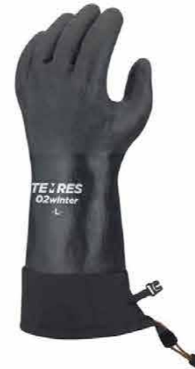
TEMRES (テムレス) グローブ 02 winter 3828 円 (税込)